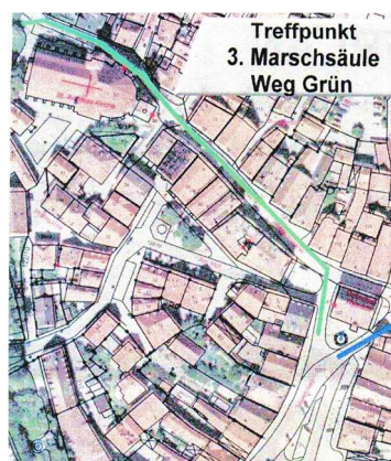
Treffpunkt und Marschrichtung

17.45 Uhr Treffpunkt Grünfläche westlich der St. Andreas-Kirche Grün