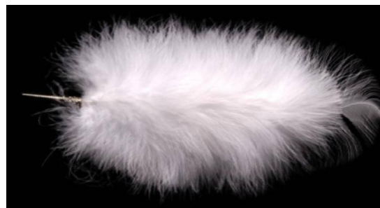
Flaumfeder - Adlerflaum 23cm