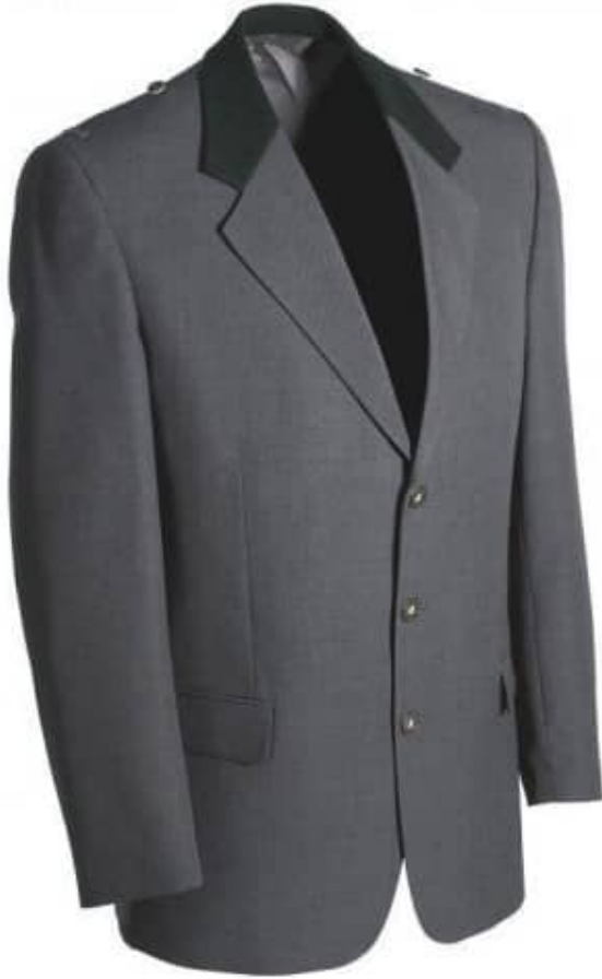
Schützenjacke Hubertus dunkelgrau meliert