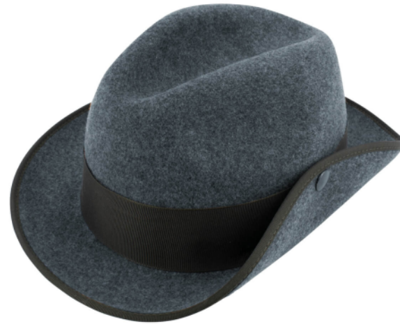
Schützenhut grau meliert mit schmaler Krempe + Druckknopf