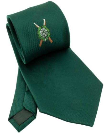
Schützenkrawatte grün mit gewebtem Emblem

Wappen zum Aufnähen bei Schützenmeister abholen