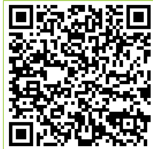
Ausschreibungsheft 2026 Gaue Ansbach, Hesselberg, Weißenburg

Interesse an Lehrgängen und Weiterbildung?